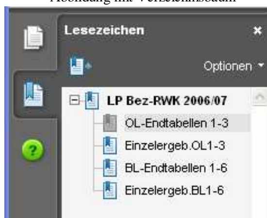
Abbildung mit Verzeichnisbaum

Durch Öffnen der „Lesezeichen“ im Acrobat-Reader wird der Verzeichnisbaum sichtbar und die verschiedenen Tabellen lassen sich gezielt auswählen!